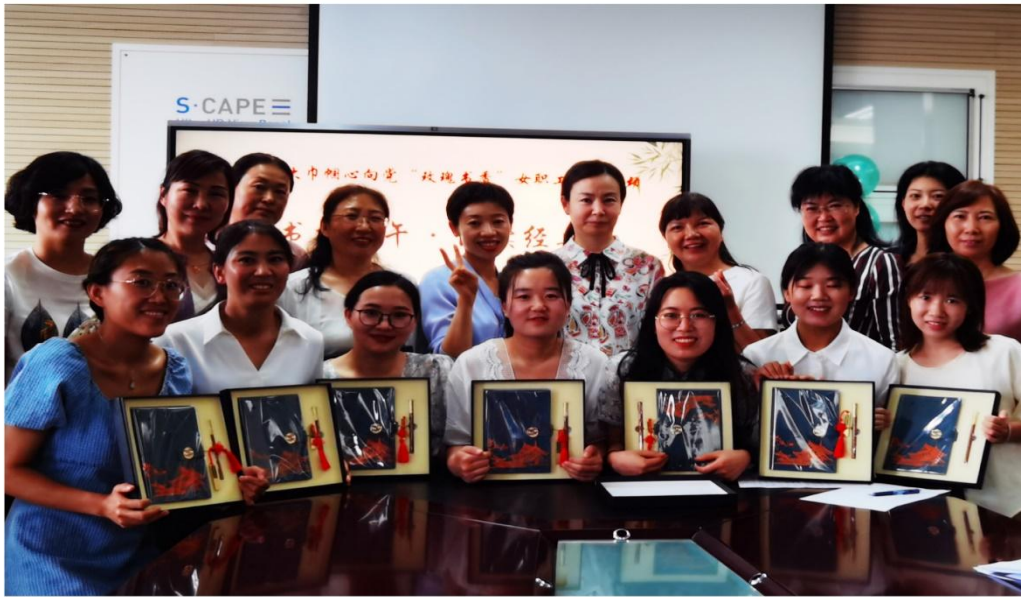
喜迎二十大巾帼心向党 书香端午.诵读经典

女职工们的朗诵声情并茂、铿锵有力，富有节奏感和韵律美。通过她们的朗诵，在场的听众不仅感受到了朗诵艺术的魅力，陶冶了情操、净化了心灵，而且提升了爱国热情，进一步展现我院女职工立足岗位，听党话、跟党走智慧美和自信美。